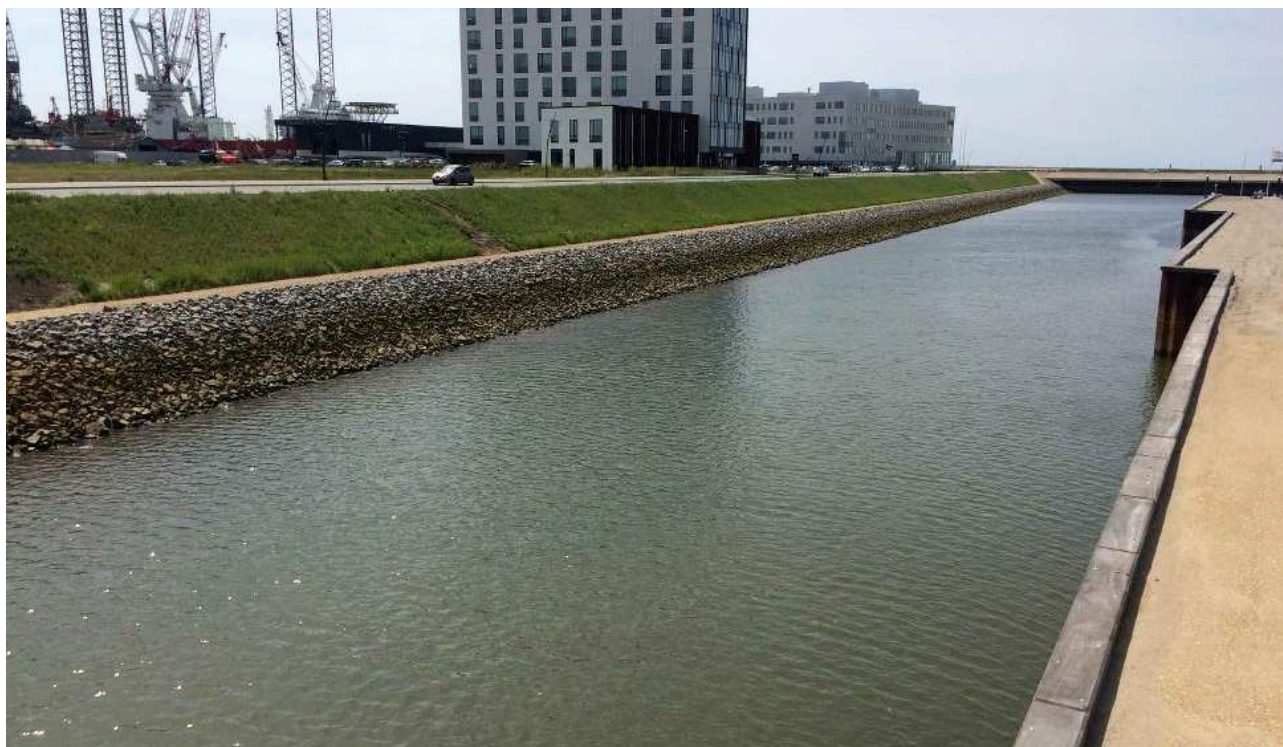
Badeområdet ved Esbjerg Strand

Toiletfaciliteter findes i Maritimt Center, bygningen tilknyttet Projekt Aqtv når denne er færdigbygget, og midlertidige toiletter vil blive stillet op efter behov.