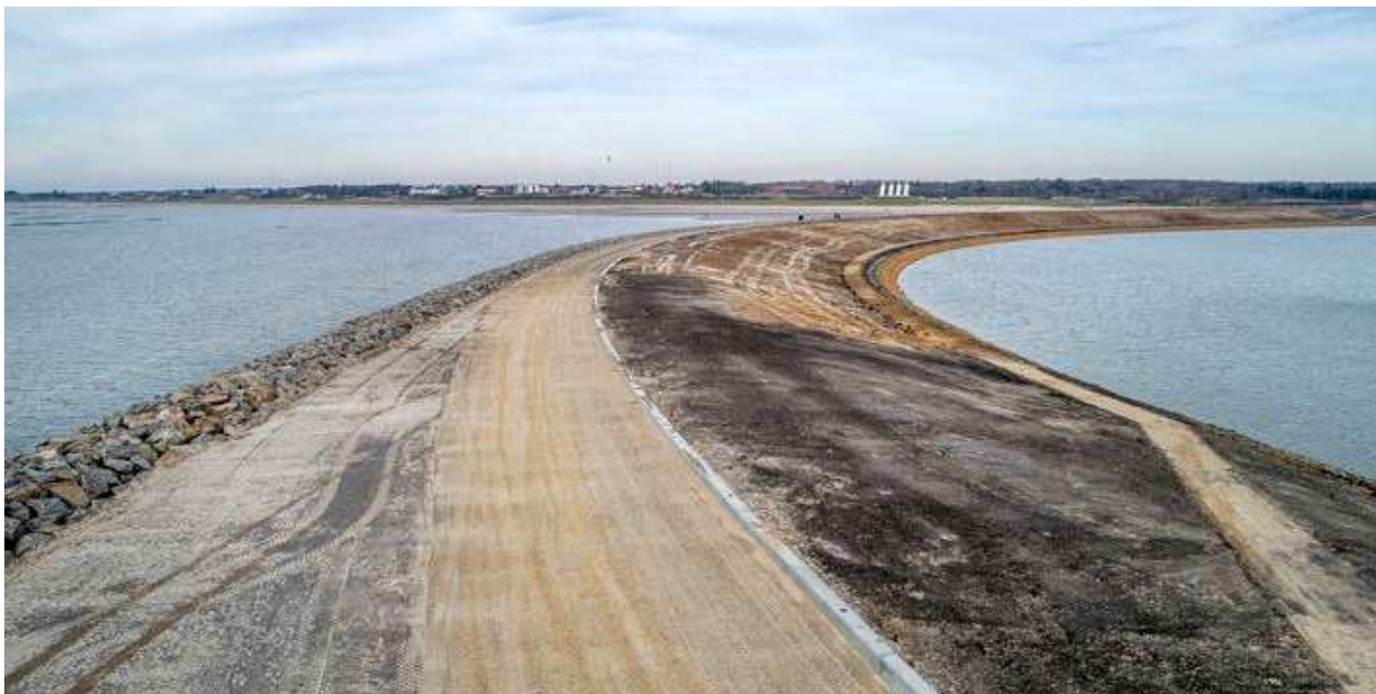
Molen ved Esbjerg Strand

Vandet indeholder fint svævestof af naturligt vadehavsslik og er derfor uklart. Det er normalt ikke alger, og reglen om, at man skal kunne se sine tæer, gælder generelt ikke i vadehavet.