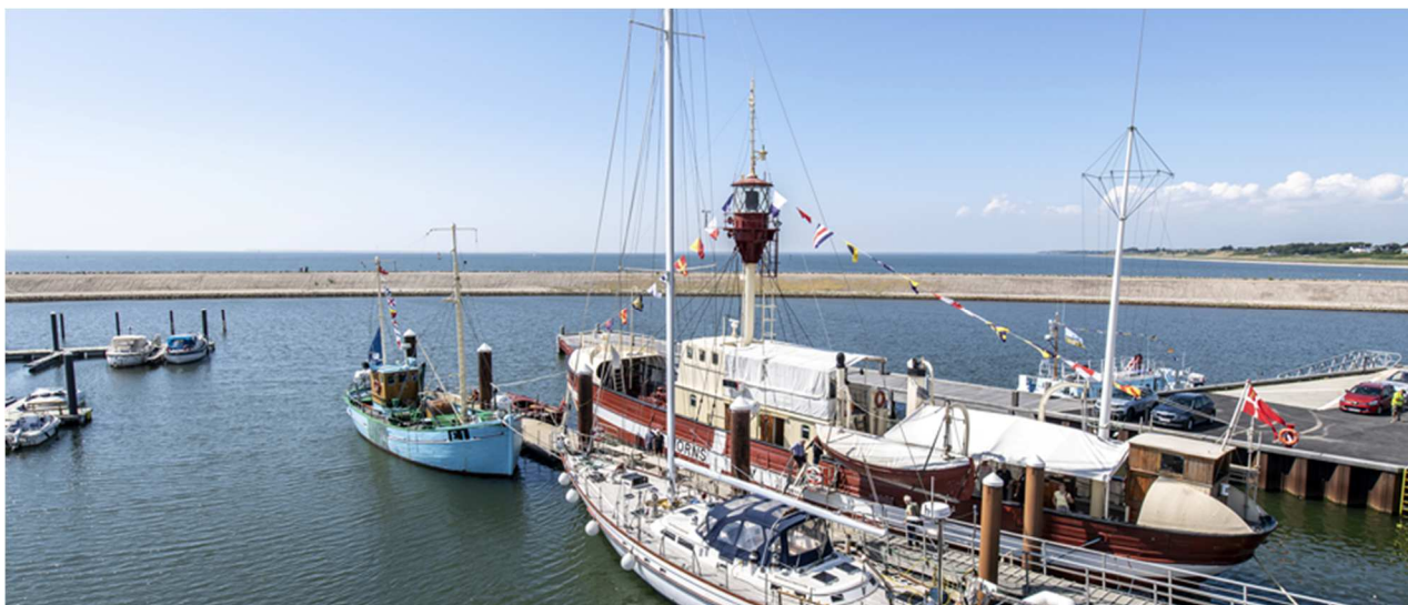
Fyrskib nr. 1 "Horns-Rev" ved Esbjerg Strand