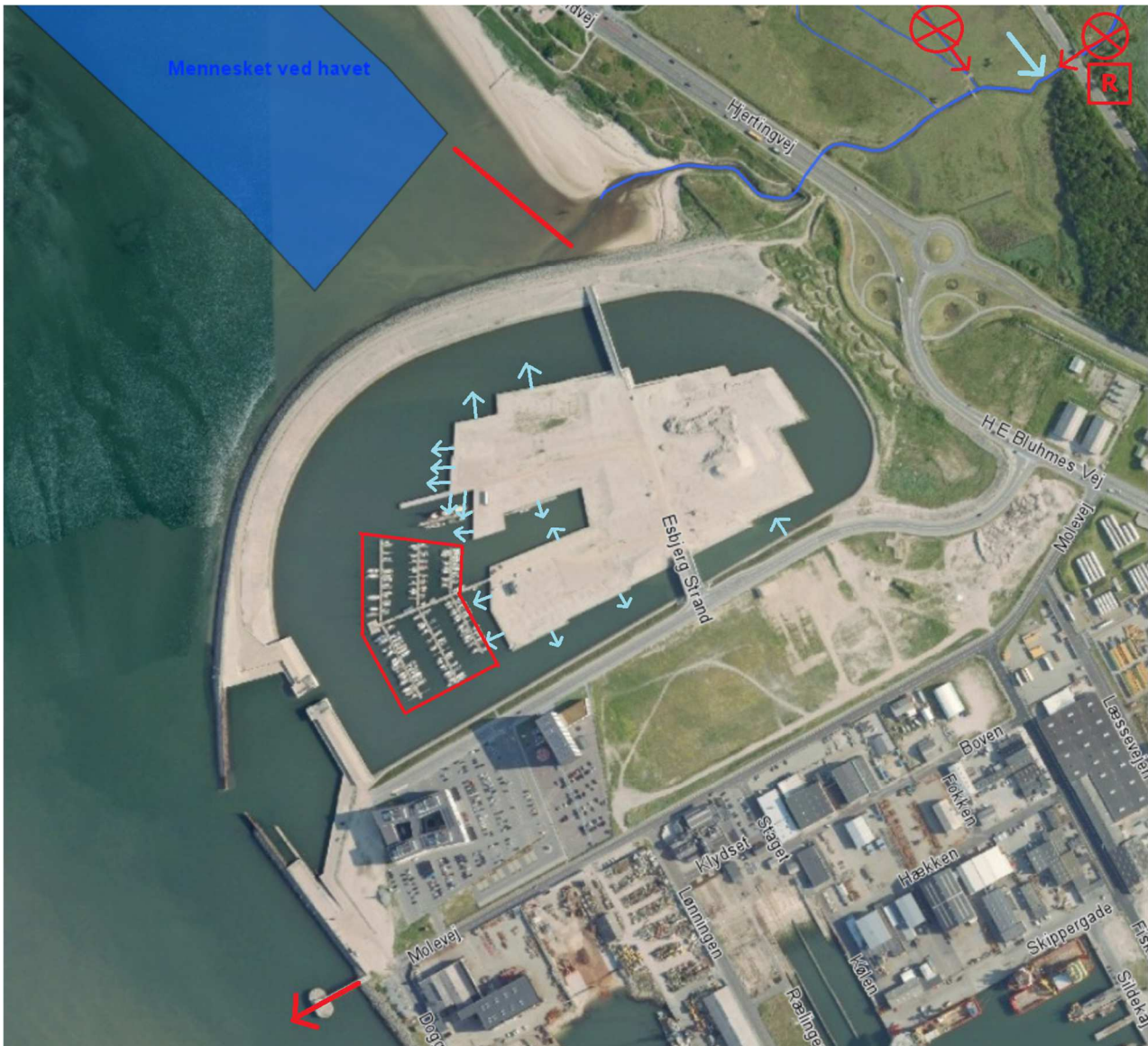
Overblik over de nærmeste mulige kilder til forurening af badevandet ved Esbjerg Strand

Esbjerg Kommune opfordrer til at strandens gæster bader indenfor den definerede afgrænsning af badeområdet, hvor kommunen rutinemæssigt kontrollerer badevandskvaliteten i badevandssæsonen (1. juni – 1. september).